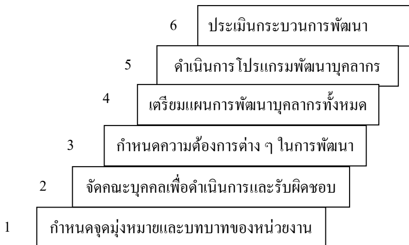
ภาพที่ 2.1 กระบวนการพัฒนาครู