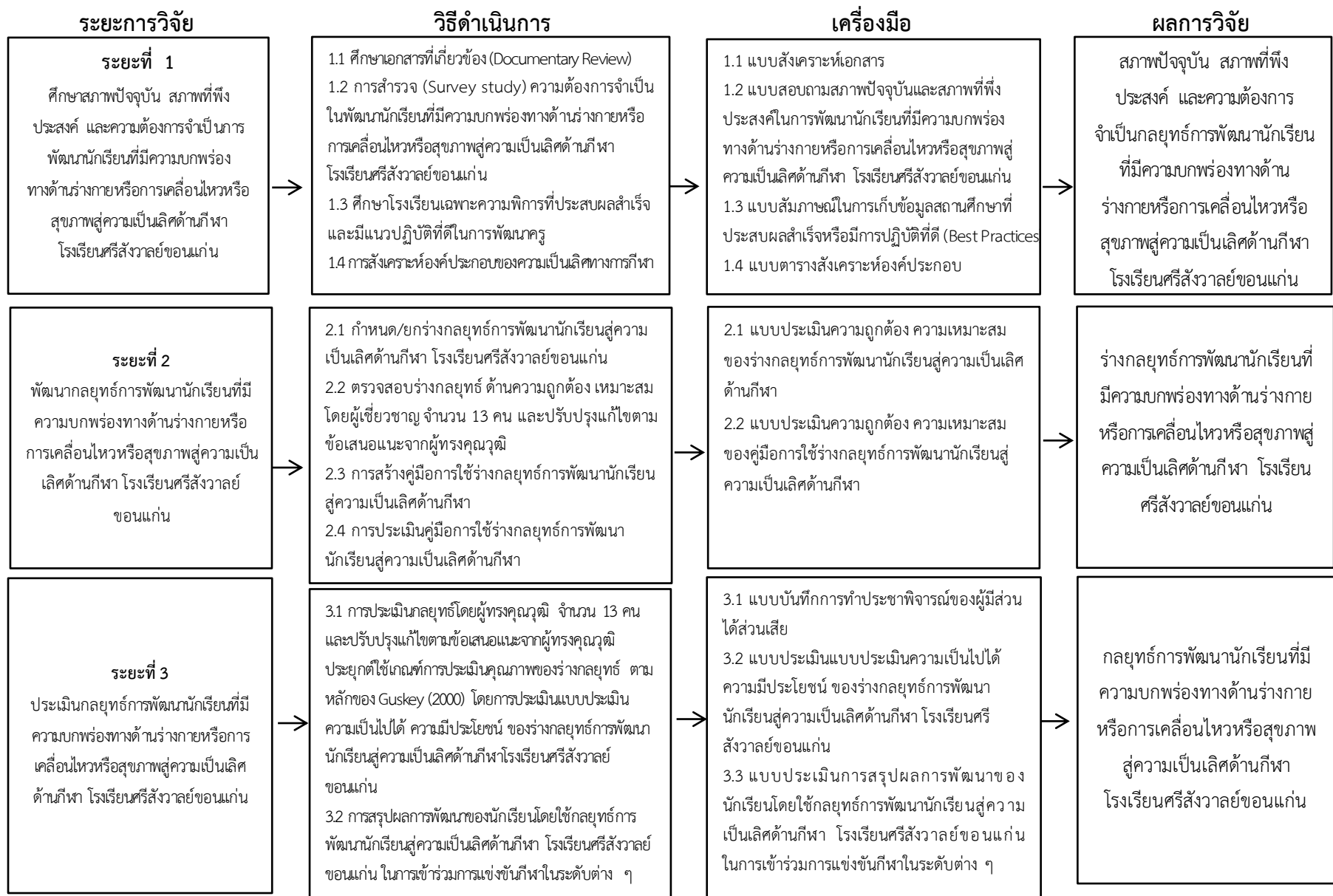
ภาพที่ 3.1 ขั้นตอนการวิจัย กลยุทธ์การพัฒนานักเรียนที่มีความบกพร่องทางด้านร่างกายหรือการเคลื่อนไหวหรือสุขภาพผู้มีความเป็นเลิศด้านกีฬาโรงเรียนศรีสังวาลย์ขอนแก่น