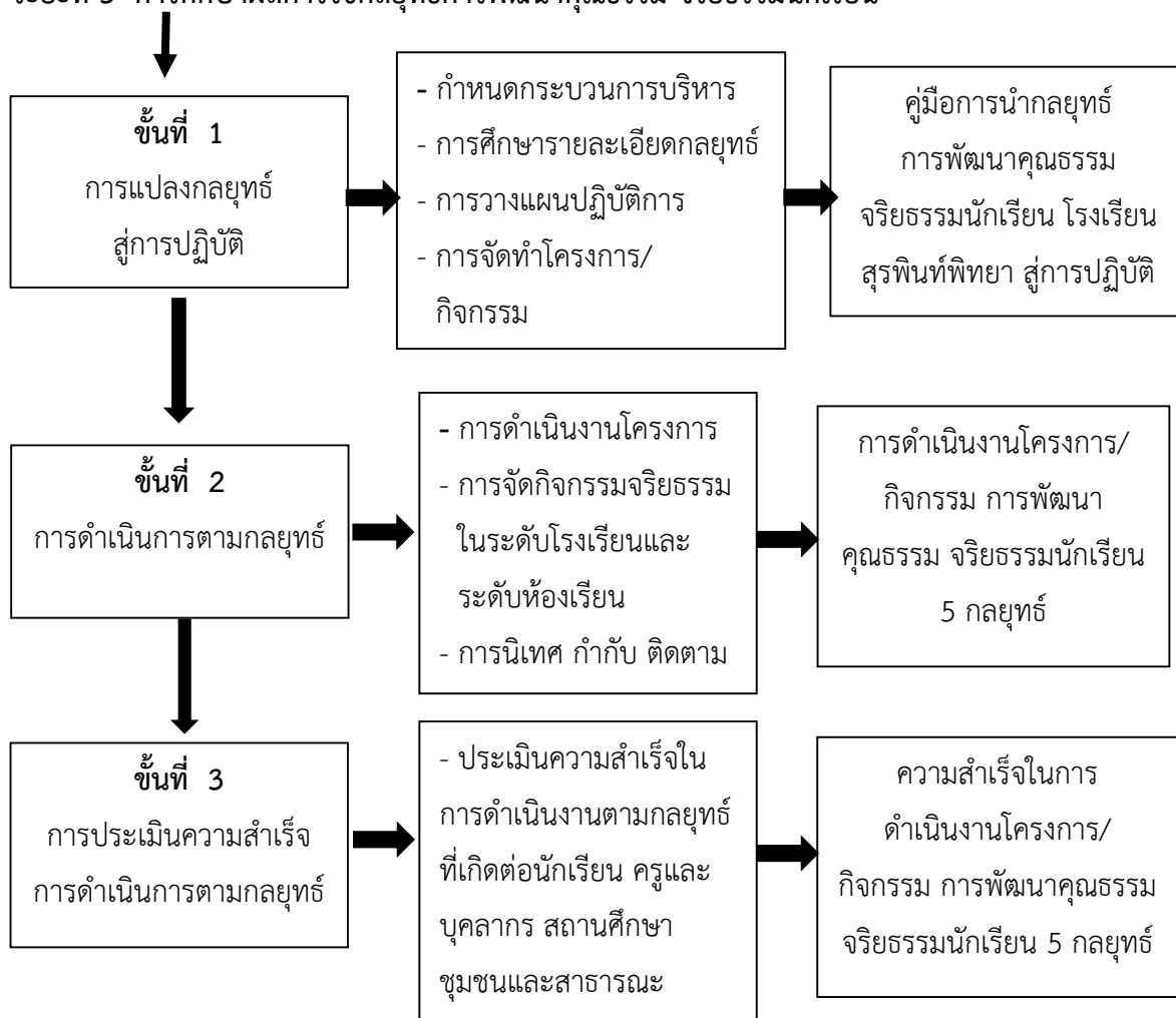
ภาพประกอบ 13 แสดงขั้นตอนการดำเนินการวิจัย

รายละเอียดการดำเนินการวิจัยในแต่ละขั้นตอน มีดังนี้