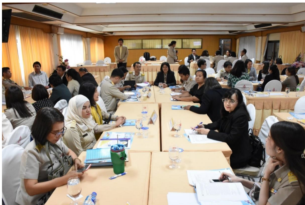
ร่วมกันวิเคราะห์ สภาพปัจจุบัน ปัญหาและแนวทางพัฒนาการจัดการเรียนการสอนเป็นภาษาอังกฤษ ตามหลักสูตรกระทรวงศึกษาธิการ