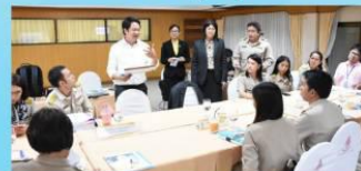
วิทยากรประจำกลุ่มนำอภิปรายในการประชุม