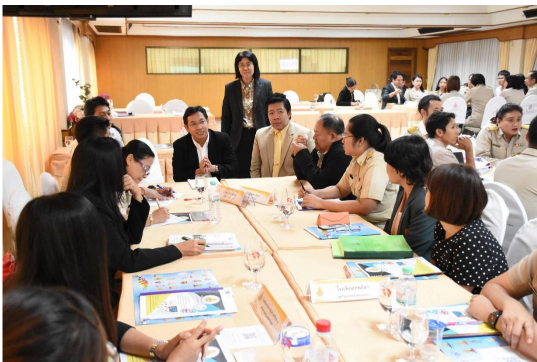
ร่วมกันวิเคราะห์ สภาพปัจจุบัน ปัญหาและแนวทางพัฒนาการจัดการเรียนการสอนเป็นภาษาอังกฤษ ตามหลักสูตรกระทรวงศึกษาธิการ