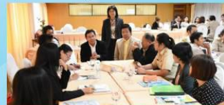
กิจกรรมประชุมกลุ่มย่อย