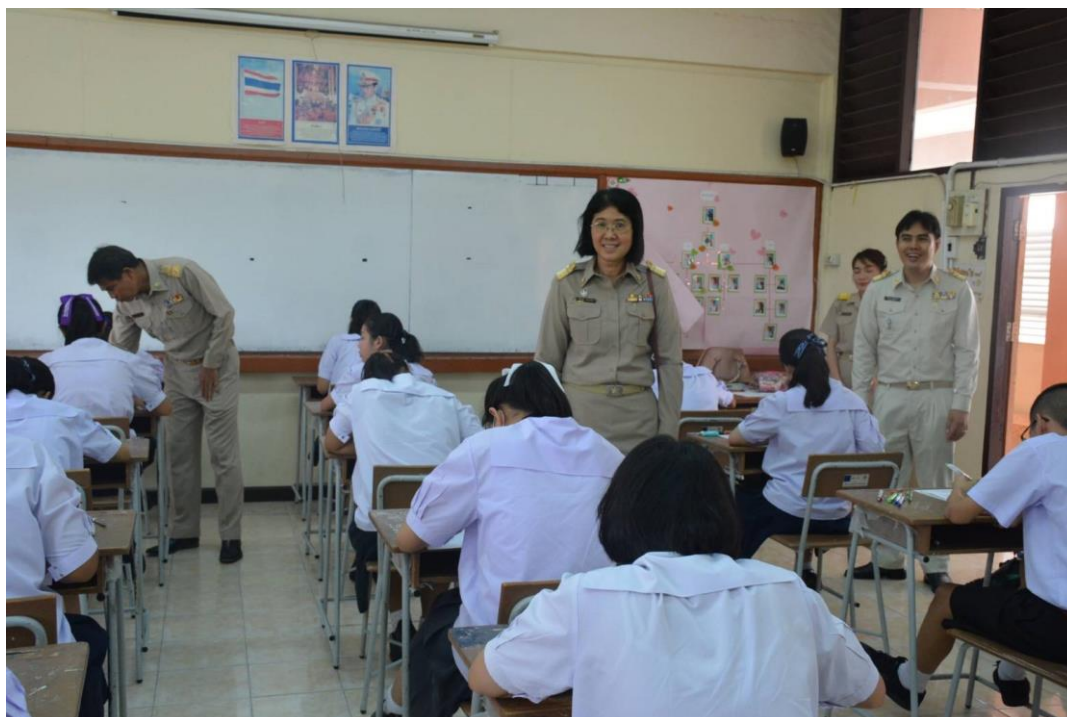
การตรวจเยี่ยม นิเทศ ติดตามและประเมินผล โรงเรียนในสังกัดสำนักงานเขตพื้นที่การศึกษามัธยมศึกษา เขต 2 ที่เข้าร่วมโครงการจัดการเรียนการสอนเป็นภาษาอังกฤษ ตามหลักสูตรกระทรวงศึกษาธิการ