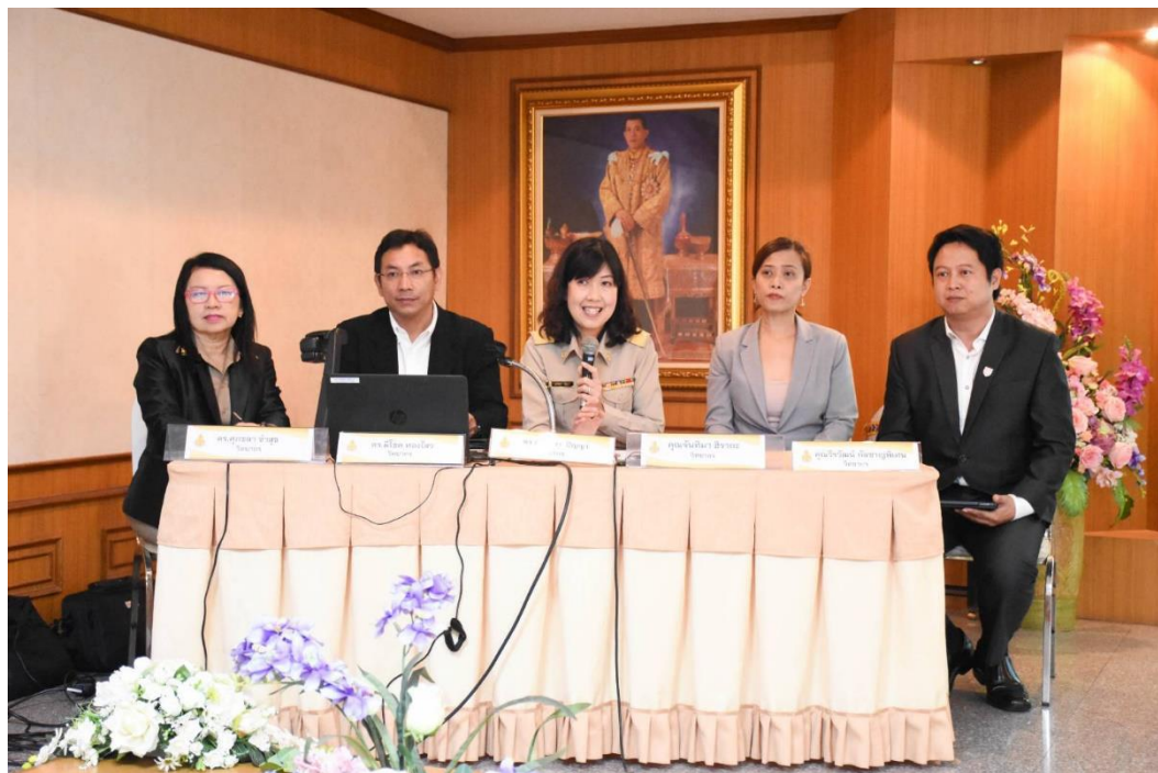
คณะวิทยากร จากสถาบันภาษาอังกฤษ สพฐ. ให้แนวทางการดำเนินการโครงการจัดการเรียนการสอน เป็นภาษาอังกฤษตามหลักสูตรกระทรวงศึกษาธิการ และการประเมินภาษาอังกฤษตามกรอบ CEFR