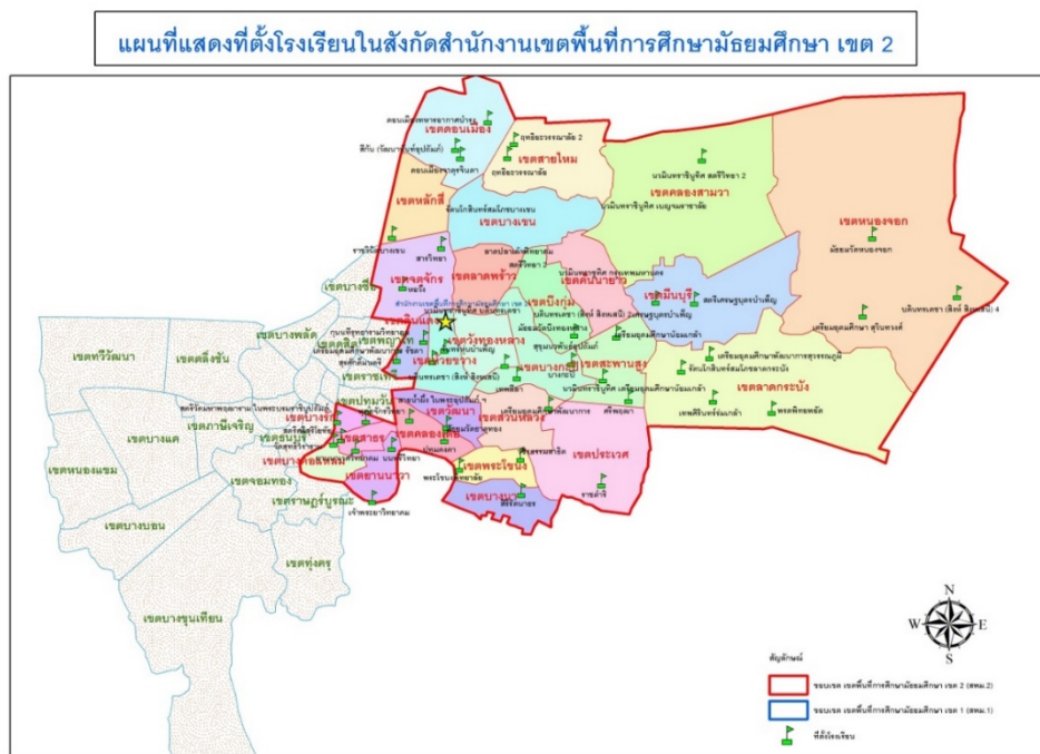
ภาพที่ 2 แผนที่แสดงที่ตั้งโรงเรียนในสังกัดสำนักงานเขตพื้นที่การศึกษามัธยมศึกษา เขต 2

เขตพื้นที่บริการของ สพม.2 ประกอบด้วย 27 เขต ของกรุงเทพมหานคร ได้แก่ เขตคลองสามวา เขตคันนายาว เขตจตุจักร เขตดอนเมือง เขตบางกะปิ เขตบางเขน เขตบึงกุ่ม เขตประเวศ เขตมีนบุรี เขตลาดกระบัง เขตลาดพร้าว เขตวังทองหลาง เขตสวนหลวง เขตสะพานสูง เขตสายไหม เขตหนองจอก เขตหลักสี่ เขตห้วยขวาง เขตคลองเตย เขตดินแดง เขตบางคอแหลม เขตบางนา เขตบางรัก เขตพระโขนง เขตยานนาวา เขตวัฒนา และเขตสาทร แผนที่ที่ตั้งโรงเรียนสังกัด สพม.2 แสดงดังภาพ