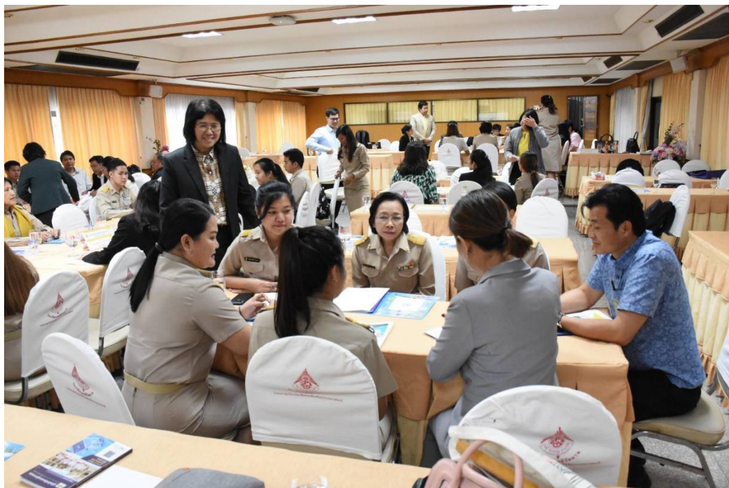
กิจกรรมกลุ่มย่อย ในการประเมินผลโครงการจัดการเรียนการสอนเป็นภาษาอังกฤษ ตามหลักสูตรกระทรวงศึกษาธิการ สังกัดสำนักงานเขตพื้นที่การศึกษามัธยมศึกษา เขต 2