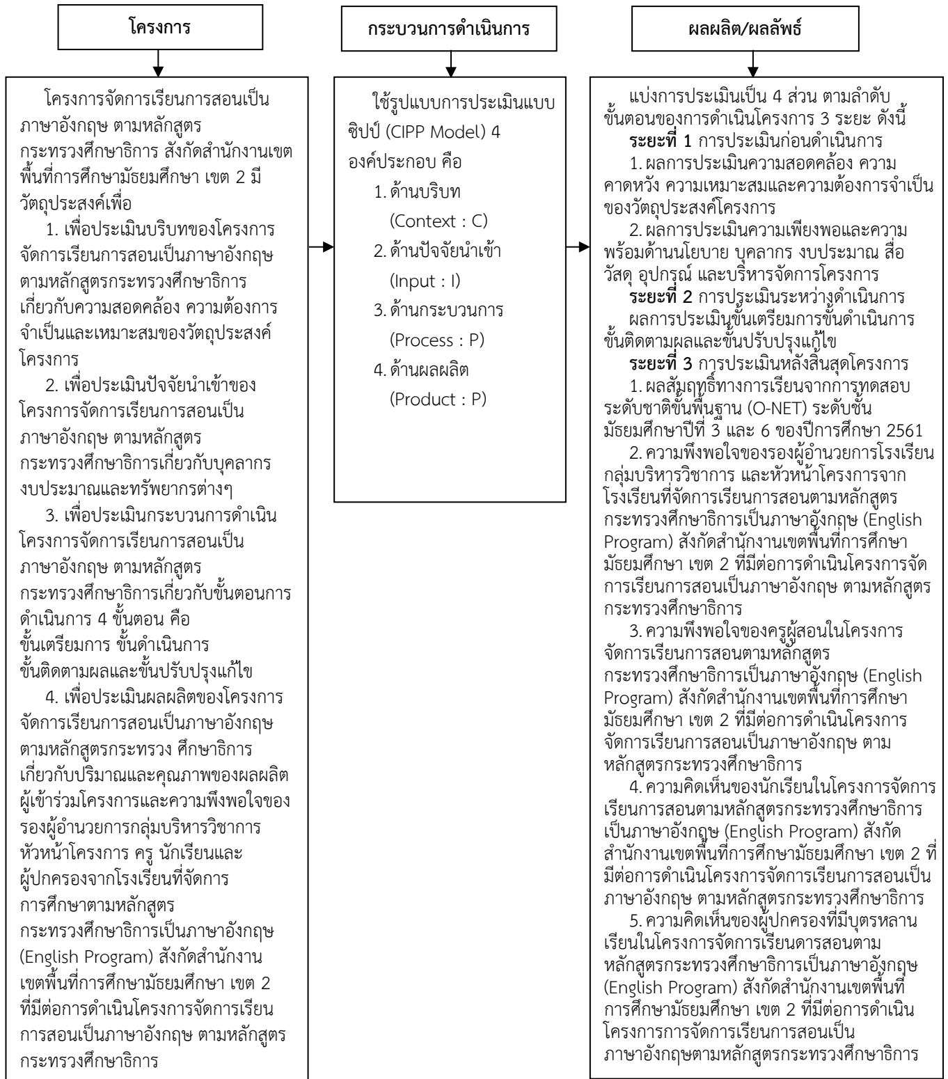
ภาพที่ 4 กรอบแนวคิดการประเมินโครงการจัดการเรียนการสอนเป็นภาษาอังกฤษตามหลักสูตร

กระทรวงศึกษาธิการ สังกัดสำนักงานเขตพื้นที่การศึกษามัธยมศึกษา เขต 2