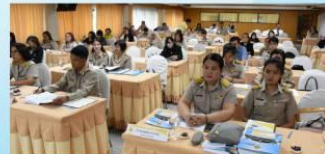
ผู้บริหารและครูฟังการบรรยายอย่างตั้งใจ