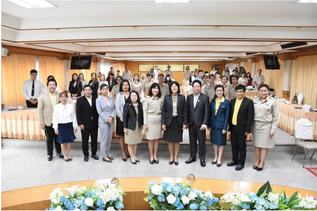
คณะวิทยากร จากสถาบันภาษาอังกฤษ สพฐ. คณะผู้บริหาร ครู โรงเรียนที่เปิดสอนหลักสูตร EP/MEP ในสังกัด สพม. 2 ถ่ายภาพร่วมกัน