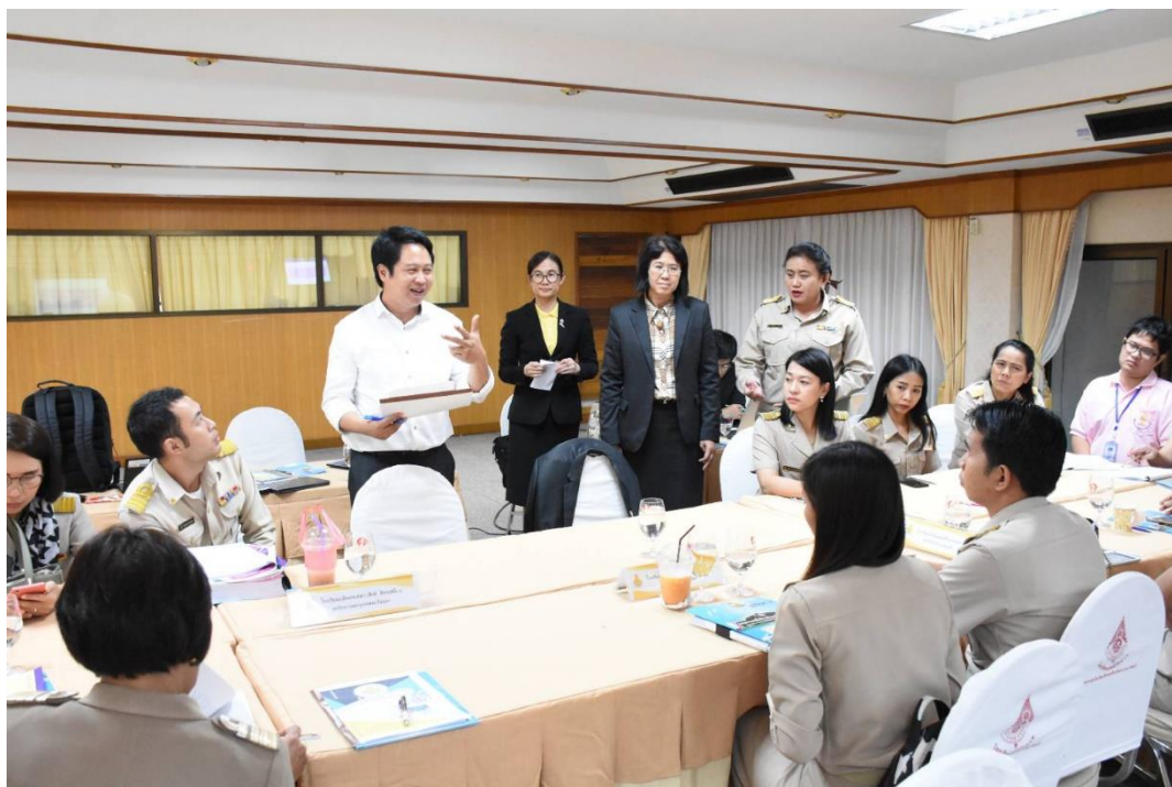
กิจกรรมกลุ่มย่อย ในการประเมินผลโครงการจัดการเรียนการสอนเป็นภาษาอังกฤษ ตามหลักสูตรกระทรวงศึกษาธิการ สังกัดสำนักงานเขตพื้นที่การศึกษามัธยมศึกษา เขต 2