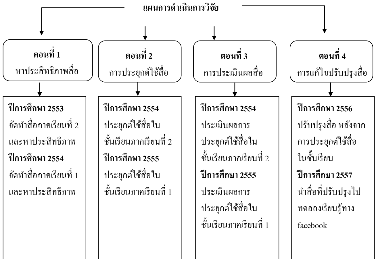
ภาพที่ 3.1 แสดงขั้นตอนการวิจัยและพัฒนาสื่อบทเรียนคอมพิวเตอร์ช่วยสอน

ตอนที่ 1 การสร้างสื่อบทเรียนคอมพิวเตอร์ช่วยสอนที่มีประสิทธิภาพตามเกณฑ์ 85 / 85