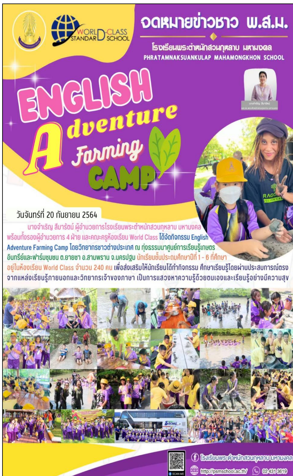
ผ.5 แหล่งเรียนรู้ภูมิปัญญาท้องถิ่น โรงเรียนพระตำหนักสวนกุหลาบ มหามงคล