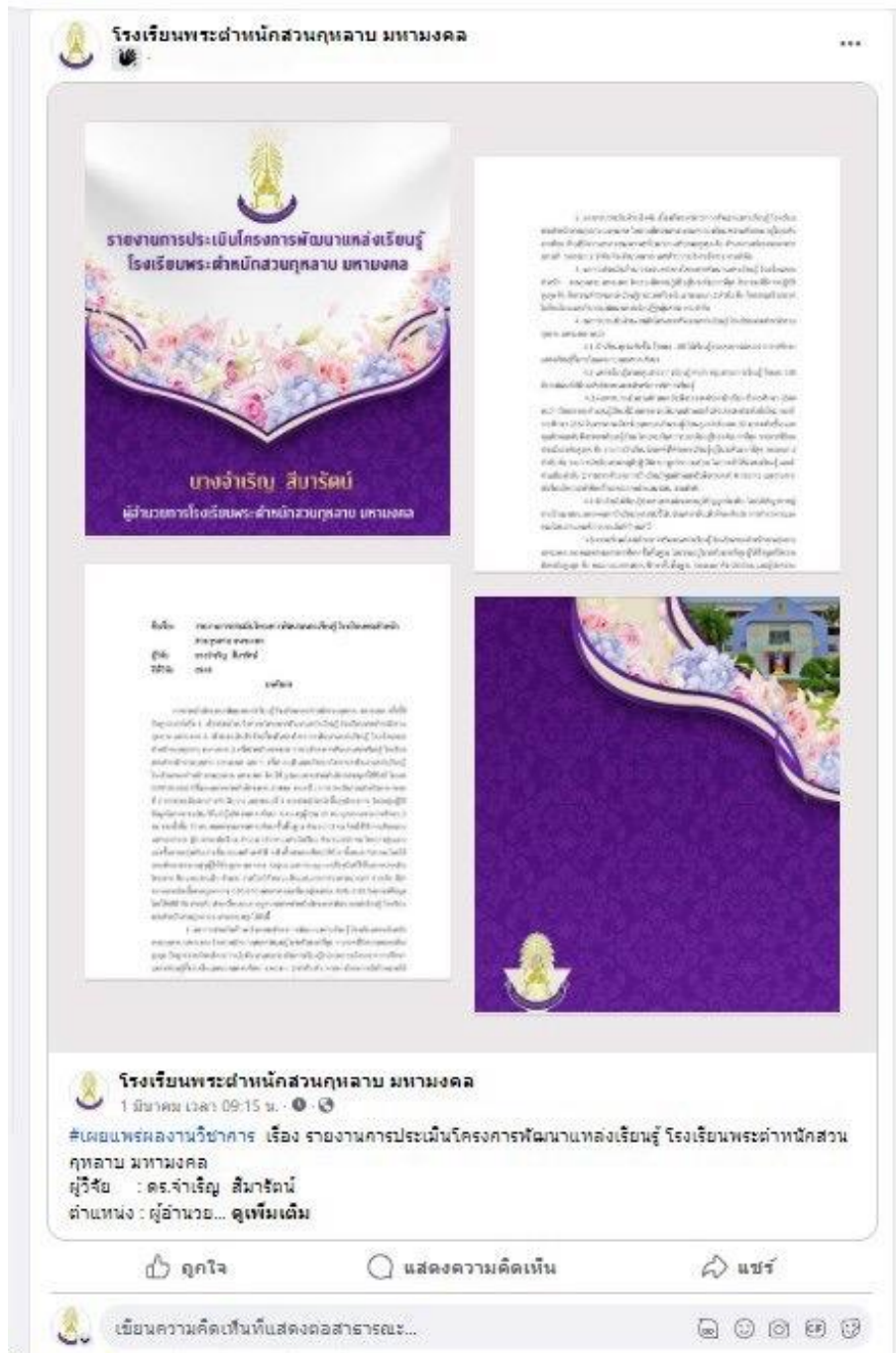
ผ.7 เผยแพร่ผลงานวิชาการ เรื่อง รายงานการประเมินโครงการพัฒนาแหล่งเรียนรู้ โรงเรียนพระตำหนักสวนกุหลาบ มหามงคล ผ่านเพจเครือข่ายประชาสัมพันธ์สำนักงานเขตพื้นที่การศึกษาประถมศึกษา นครปฐม เขต 2