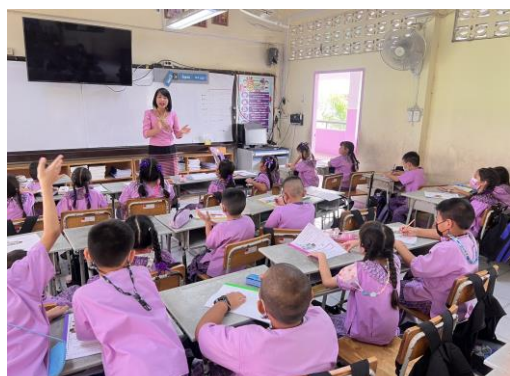
ผ.1 การดำเนินการพัฒนาแหล่งเรียนรู้ภายในห้องเรียน โรงเรียนพระตำหนักสวนกุหลาบ มหามงคล