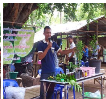
วิทยากรสาธิตและสมาชิกลงมือการปลุกมะนาวในหลุมดินด้วยตนเอง โดยใช้วัสดุขี้เถ้าในชุมชน เพื่อปรับปรุงดินเพื่อลดต้นทุน ที่บ้านด่านจาก ตำบลด่านจาก สมาชิก 15 คน