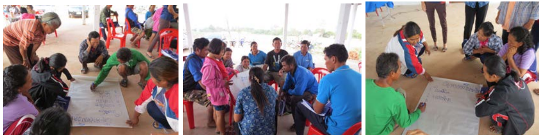
แต่ละกลุ่มจะส่งตัวแทนนำเสนอผลการระดมสมองโดยให้สมาชิกกลุ่มอื่นๆเสนอแนะเพิ่มเติม