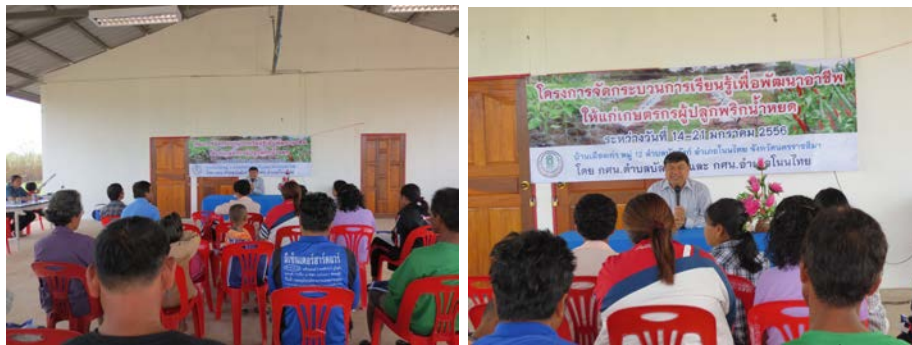
การแปรรูปพริกซึ่งเป็นการพัฒนาอาชีพที่ต่อยอดจากกลุ่มการปลูกพริกน้ำหยด