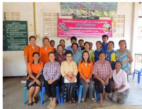
กลุ่มการทำปลาหมักคุณธรรม ที่หมู่บ้านโคกสวาย ตำบลสายออ สมาชิก 22 คน วิทยากรอธิบายประโยชน์การปลุกมะนาว การขยายพันธุ์มะนาวโดยวิธีการตอนกิ่ง และสาธิตการขยายพันธุ์กิ่งมะนาวด้วยวิธีการตอนกิ่ง