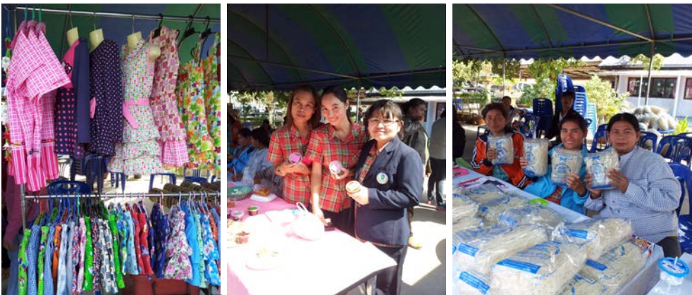
การตัดเย็บเสื้อผ้า การแปรรูปพริก การทำเส้นหมี่บ้านวัง