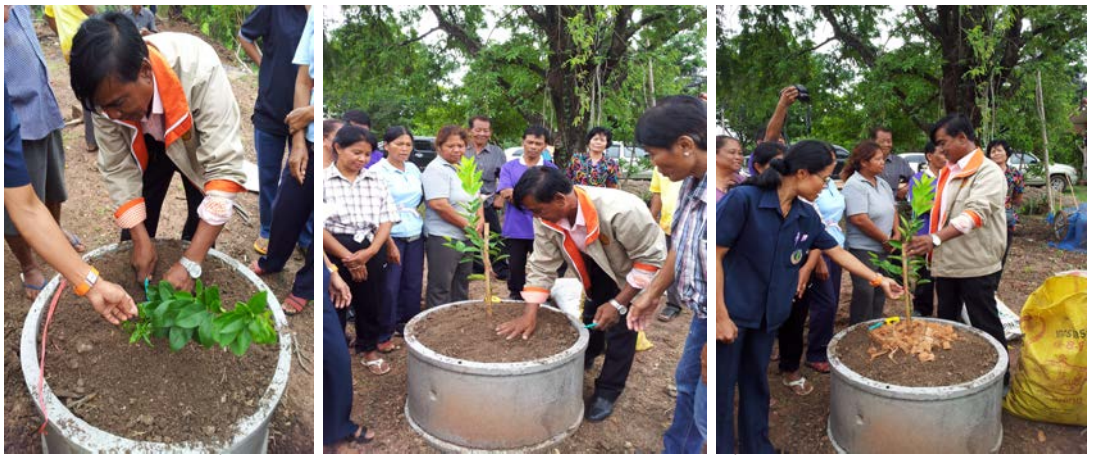
วิทยากรบรรยายเรื่องการบังคับมะนาวให้ออกผลนอกฤดูการผลิต ที่มะนาวขาดแคลนและมีราคาแพงได้ ที่ตำบลมะค่า สมาชิก 15 คน

การขยายพันธุ์กิ่งมะนาวเป็นการพัฒนาต่อยอดจากการปลูกมะนาวเพื่อจำหน่ายเป็นรายได้เสริม ด้วยวิธีการเสียบยอด ต้นละ 100 บาท ที่บ้านมะนาว ตำบลมะค่า