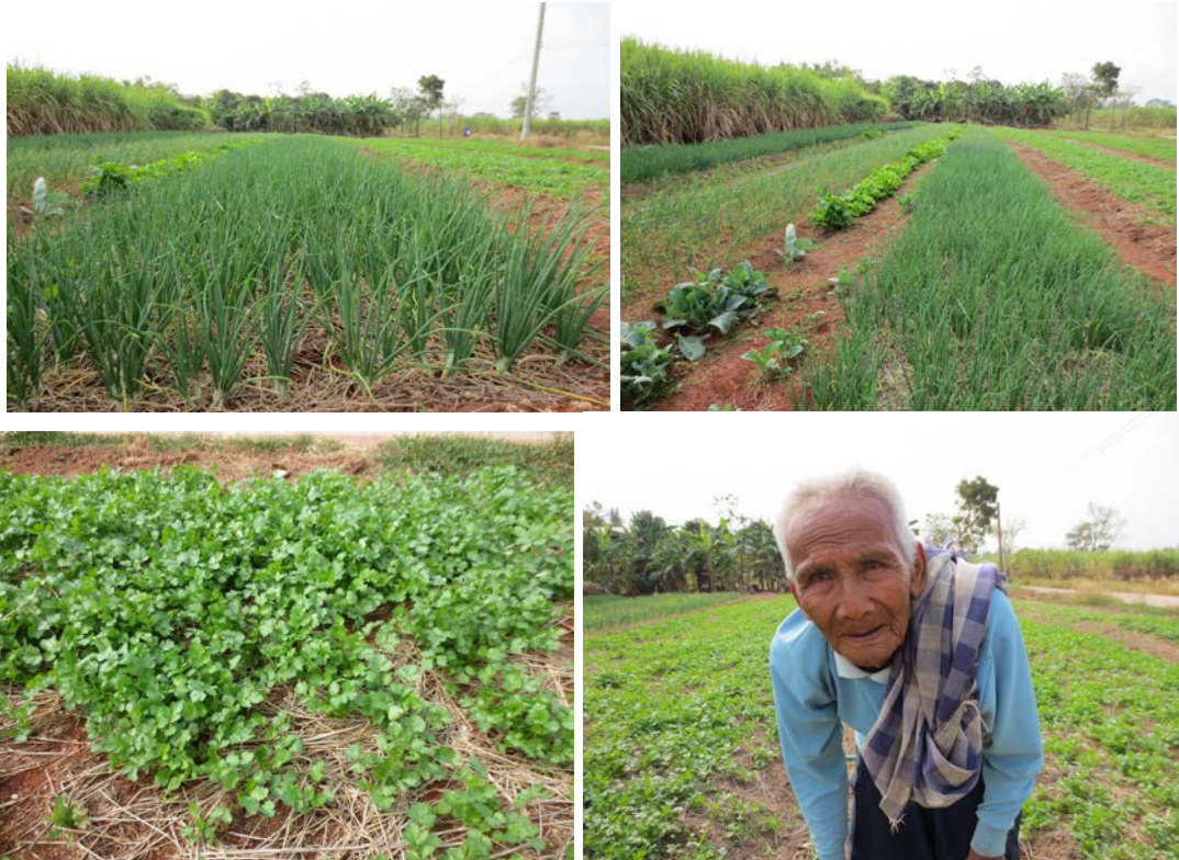
โครงการจัดกระบวนการเรียนรู้ตามหลักปรัชญาของเศรษฐกิจพอเพียงกลุ่มพัฒนาอาชีพ การปลูกพริกน้ำหยดและการปลูกผักตามฤดูกาล ที่บ้านเมืองเก่า ตำบลปลัดขันธ์