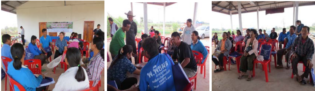
เชิญวิทยากรมาให้ความรู้เรื่องการปลูกพริกน้ำหยด การแก้ปัญหาและการป้องกันโรคพริก