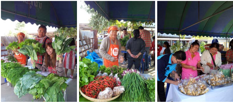
การปลูกสวนครัวตามฤดูกาล ด้วยวิธีเกษตรอินทรีย์ การทำอาหารขนมจากวัตถุดิบในชุมชน