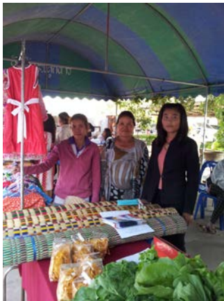
การทอเสื่อจันทบูร การทำผ้าห่มนวม การทำเบาะรองนั่ง การต่อยอดมะนาว