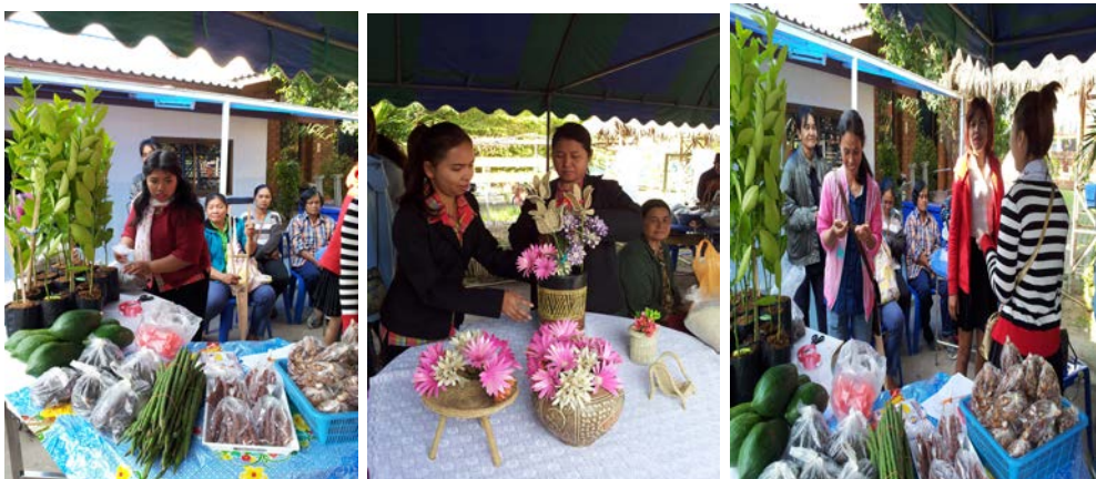
การขยายพันธุ์กิ่งมะนาว การแปรรูปผลิตภัณฑ์จากใบหญ้าแฝก พืชผักสมุนไพรในชุมชน