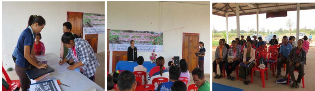
สมาชิกร่วมกันระดมสมองวิเคราะห์สภาพปัญหาและความต้องการปลูกพริกน้ำหยด