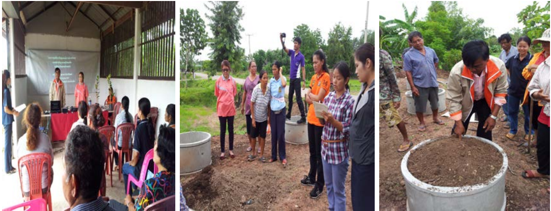
การขยายพันธุ์ด้วยวิธีการเสียบยอดและการปลูกมะนาวในวงบ่อซีเมนต์นอกฤดูการผลิต