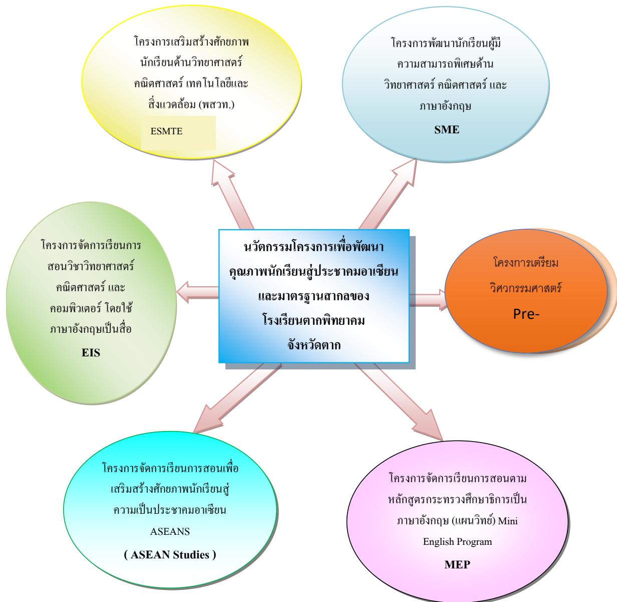
ภาพที่ 3 นวัตกรรมการพัฒนาคุณภาพนักเรียนโรงเรียนตากพิทยาคม