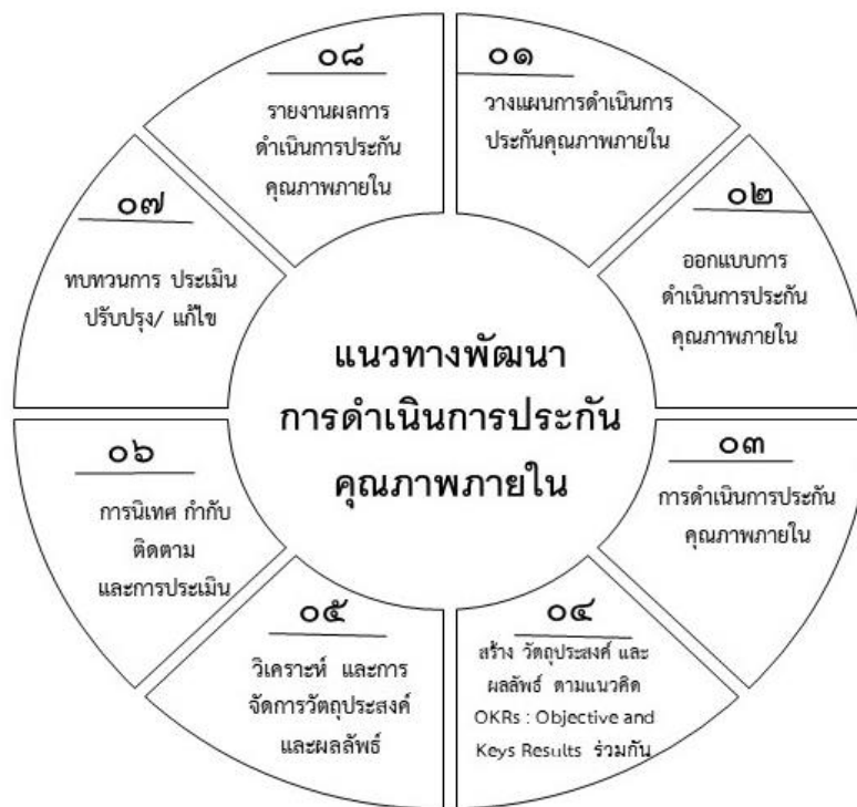
ภาพที่ ๔.๓ แสดงร่างแนวทางการดำเนินการประกันคุณภาพภายใน โดยใช้แนวคิดระบบการวัดผลแบบ OKRs : Objective and Key Results

จากนั้นผู้วิจัยนำผลการศึกษามายกร่างแนวทางการดำเนินการประกันคุณภาพภายใน โรงเรียนผืนสหราษฎร์พัฒนา โดยใช้แนวคิดระบบการวัดผลแบบ OKRs : Objective and Key Results โดยมีองค์ประกอบของขั้นตอนการดำเนินการประกันคุณภาพภายในโรงเรียนผืนสหราษฎร์พัฒนา ประกอบไปด้วย องค์ประกอบ ๘ ขั้นตอน ดังแสดงในแผนภาพที่ ๔.๓