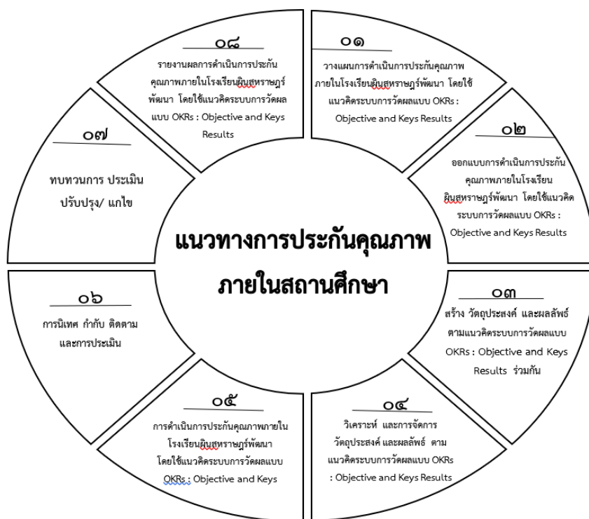
ภาพที่ ๔.๔ แสดงแนวทางพัฒนาการดำเนินการประกันคุณภาพภายในโรงเรียนผืนสหราษฎร์พัฒนา โดยใช้แนวคิดระบบการวัดผลแบบ OKRs : Objective and Key Results

จากข้อเสนอแนะของผู้เชี่ยวชาญข้างต้น ผู้วิจัยได้นำมาแก้ไข ปรับปรุง ทำให้ได้แนวทางพัฒนาการประกันคุณภาพทางการศึกษาภายในโรงเรียนผืนสหราษฎร์พัฒนา โดยใช้แนวคิดระบบการวัดผลแบบ OKR : Objective and Key Results ตามข้อเสนอแนะของผู้เชี่ยวชาญที่ปรับปรุงแล้วดังแสดงดังภาพที่ ๔.๓